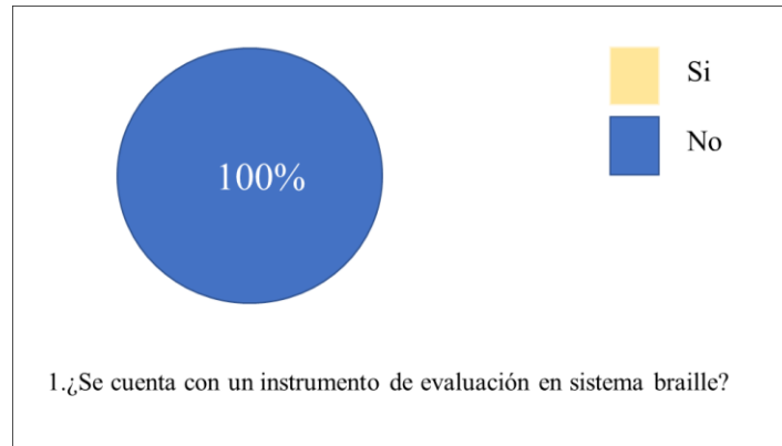
Gráfico 1. Aplicación a docentes.

explica, ocupan la habilidad de leer los labios sin embargo no es suficiente este método que ellos utilizan.