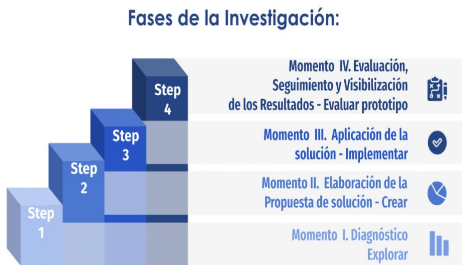
Gráfico 2. Fases de la investigación.

momentos establecidos y definidos en la Investigación Acción y en donde en cada una de estas fases de la investigación se aplican diferentes instrumentos de tipo cuantitativo que permitan tener datos cuantitativos con los cuales va ser posible realizar análisis de tendencias y determinar el nivel de impacto mediante indicadores cuantitativos y cualitativos al tiempo como se mira ese engranaje en la siguiente figura que es la que representa las fases de la investigación en coherencia con la formulación de los objetivos específicos que se van desarrollando en un nivel de menor complejidad a mayor complejidad, la cual ha sido esquematizar en el siguiente gráfico: